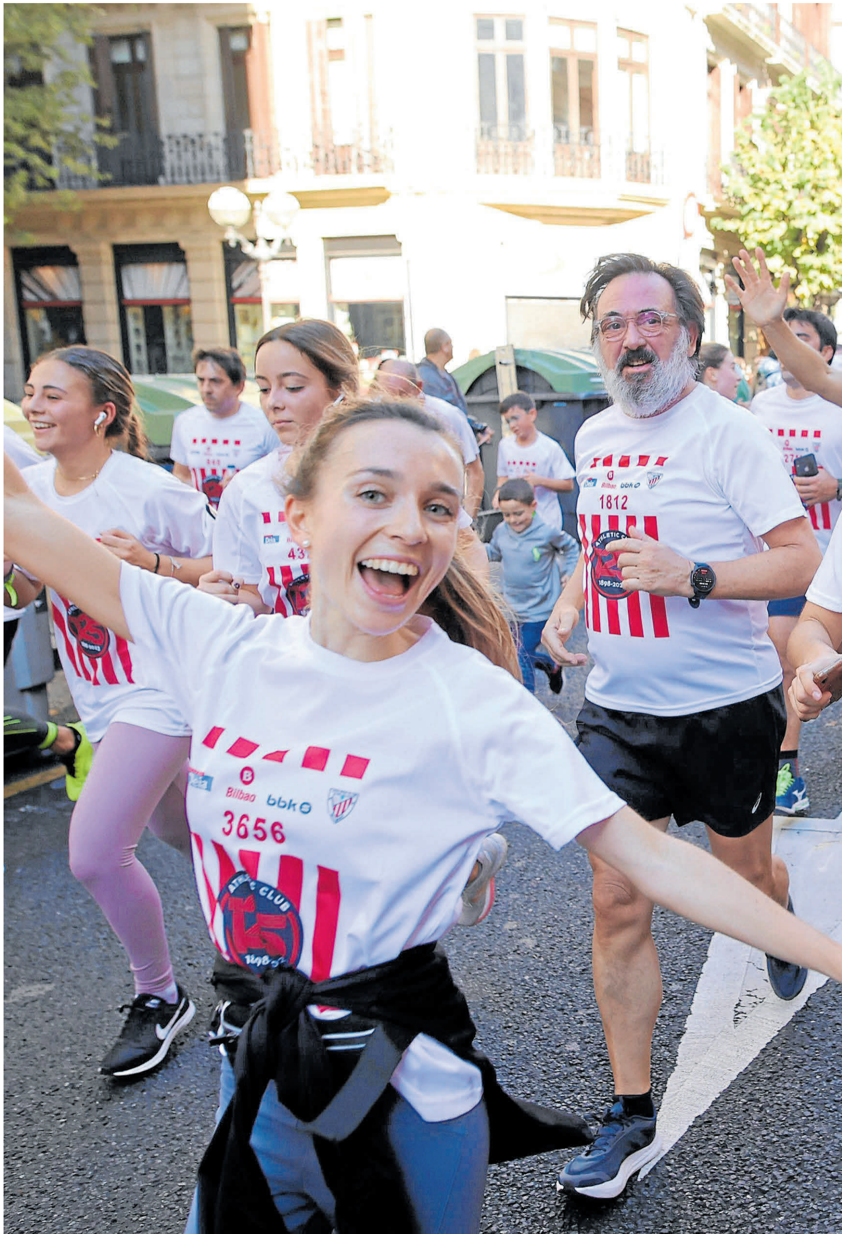
Las principales arterias de Bilbao fueron tomadas por una multitud intergeneracional.

PARTICIPANTES. La 34ª edición de la Herri Krosa fue un éxito de organización y de participantes. 10.000 ganadores se dieron cita en ella, agotando las inscripciones seis días antes de la prueba, gracias sobre todo a San Mamés, que fue el principal reclamo. La afición rojiblanca acudió a la cita con el atletismo, otra forma de celebrar el 125 aniversario del Athletic, gracias sobre todo a la vuelta que se dio sobre el césped de La Catedral, en el quinto kilómetro de la prueba. Es decir, justo en su ecuador.