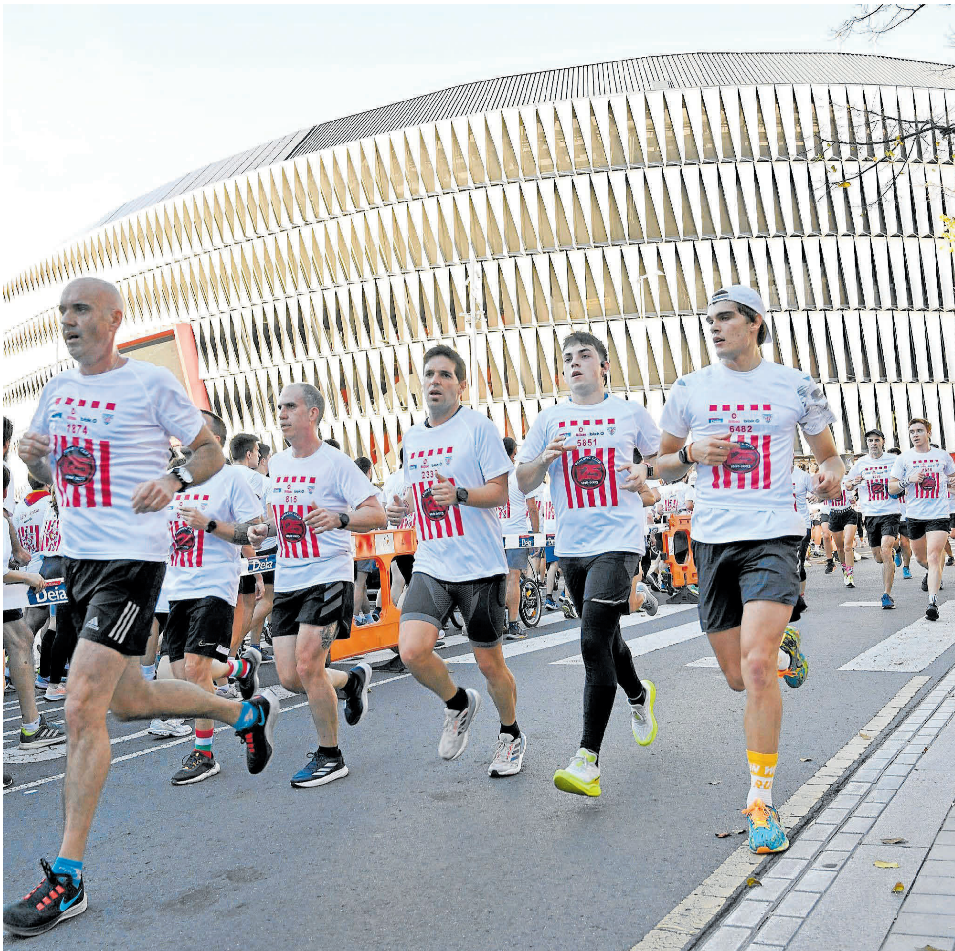
Pisar el césped de San Mamés no es algo que se haga muchas veces.