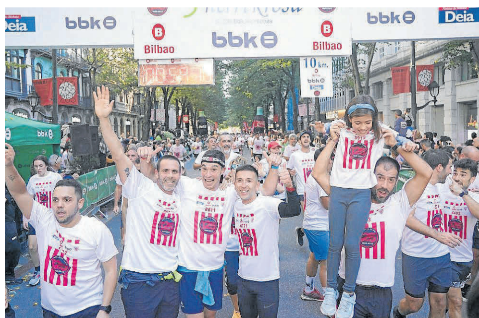
EQUIPO DE LA CRUZ ROJA Bilbao

“Desde la primera edición hasta esta nuestra labor siempre ha sido atender a los participantes y velar por su seguridad”