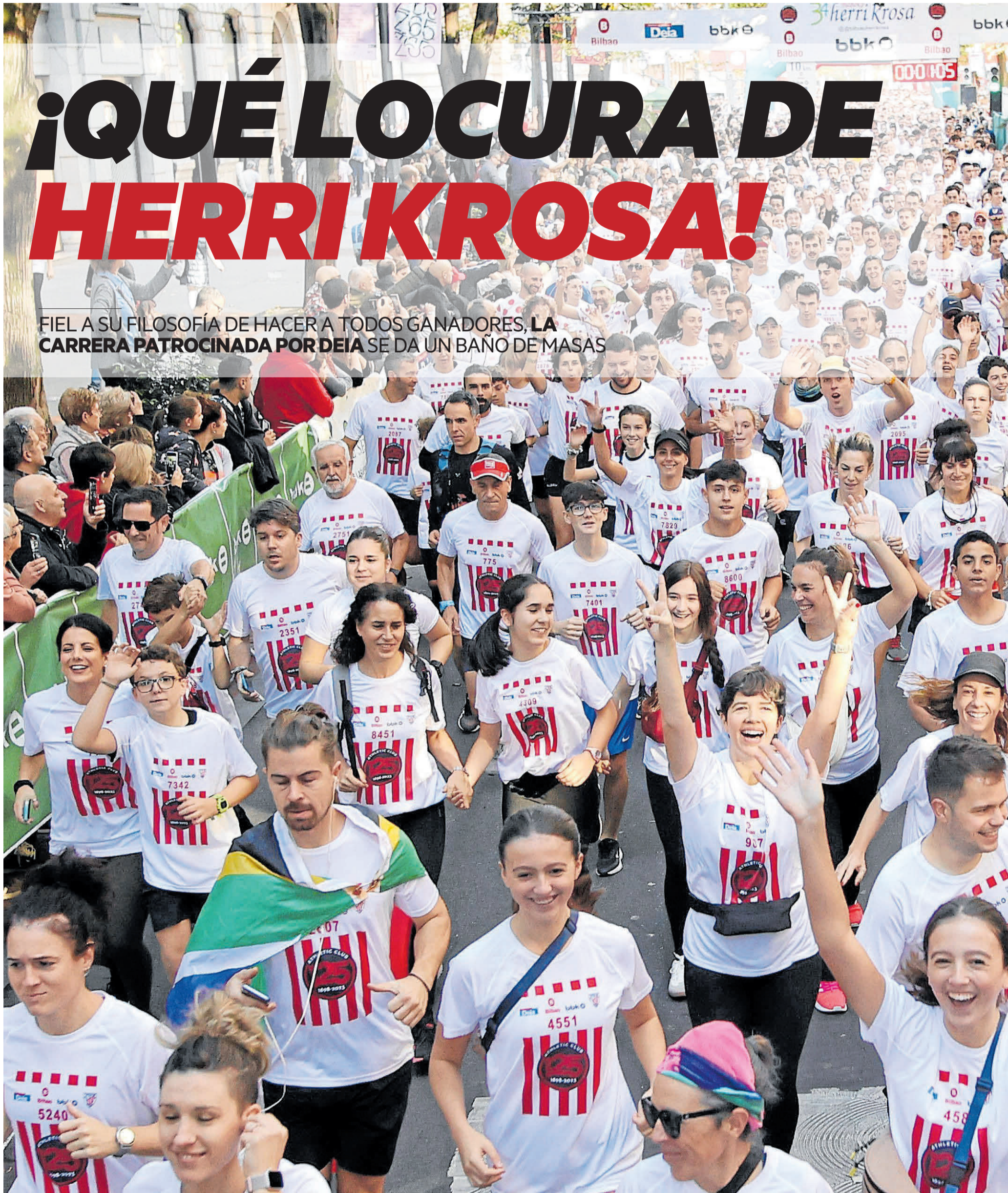
La XXXIV edición de la Herri Krosa se disputó en un ambiente deportivo y festivo.

FIEL A SU FILOSOFÍA DE HACER A TODOS GANADORES, LA CARRERA PATROCINADA POR DEIA SE DA UN BAÑO DE MASAS