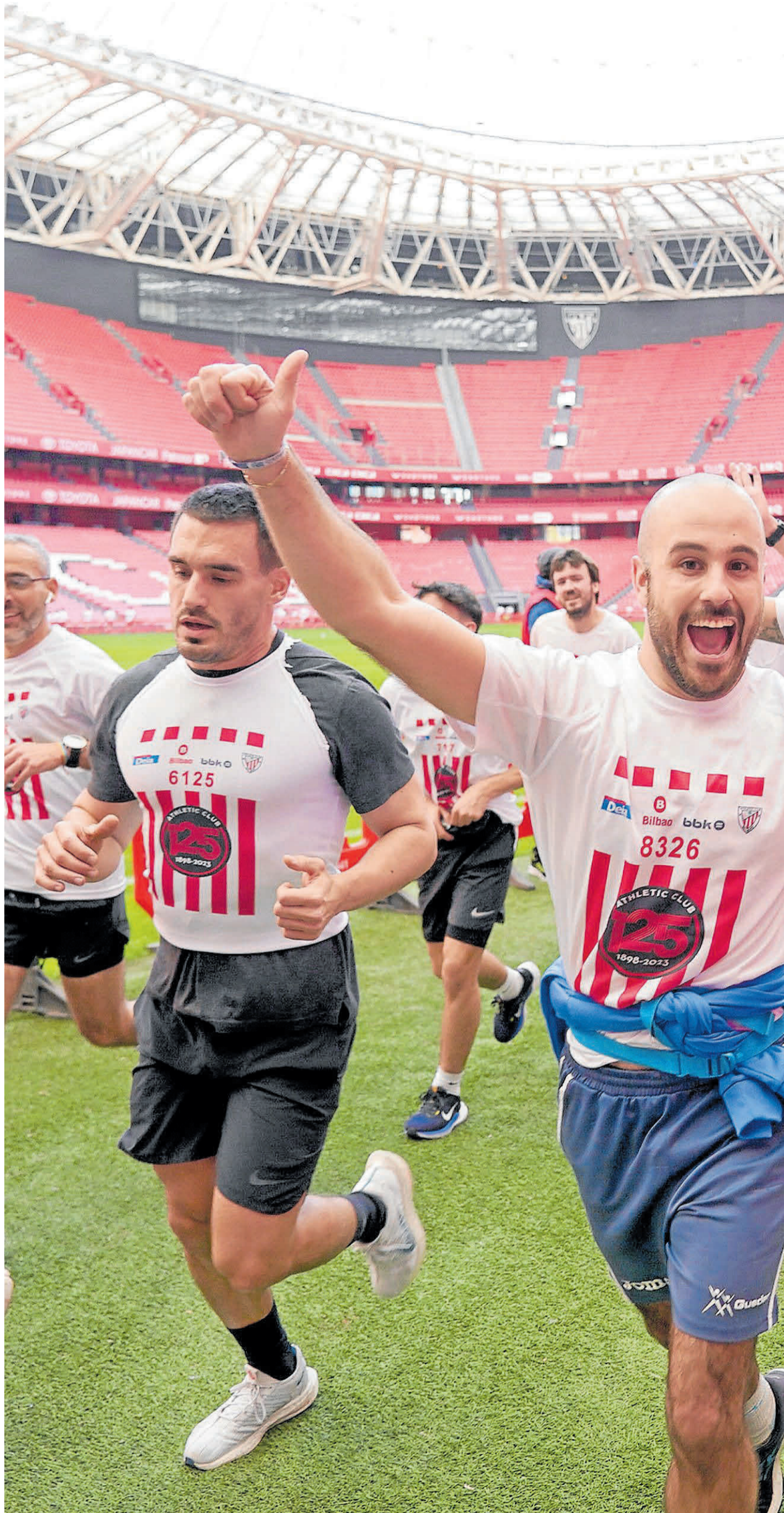
Por unos minutos, el césped de 'La Catedral' cambió el fútbol por el atletismo.